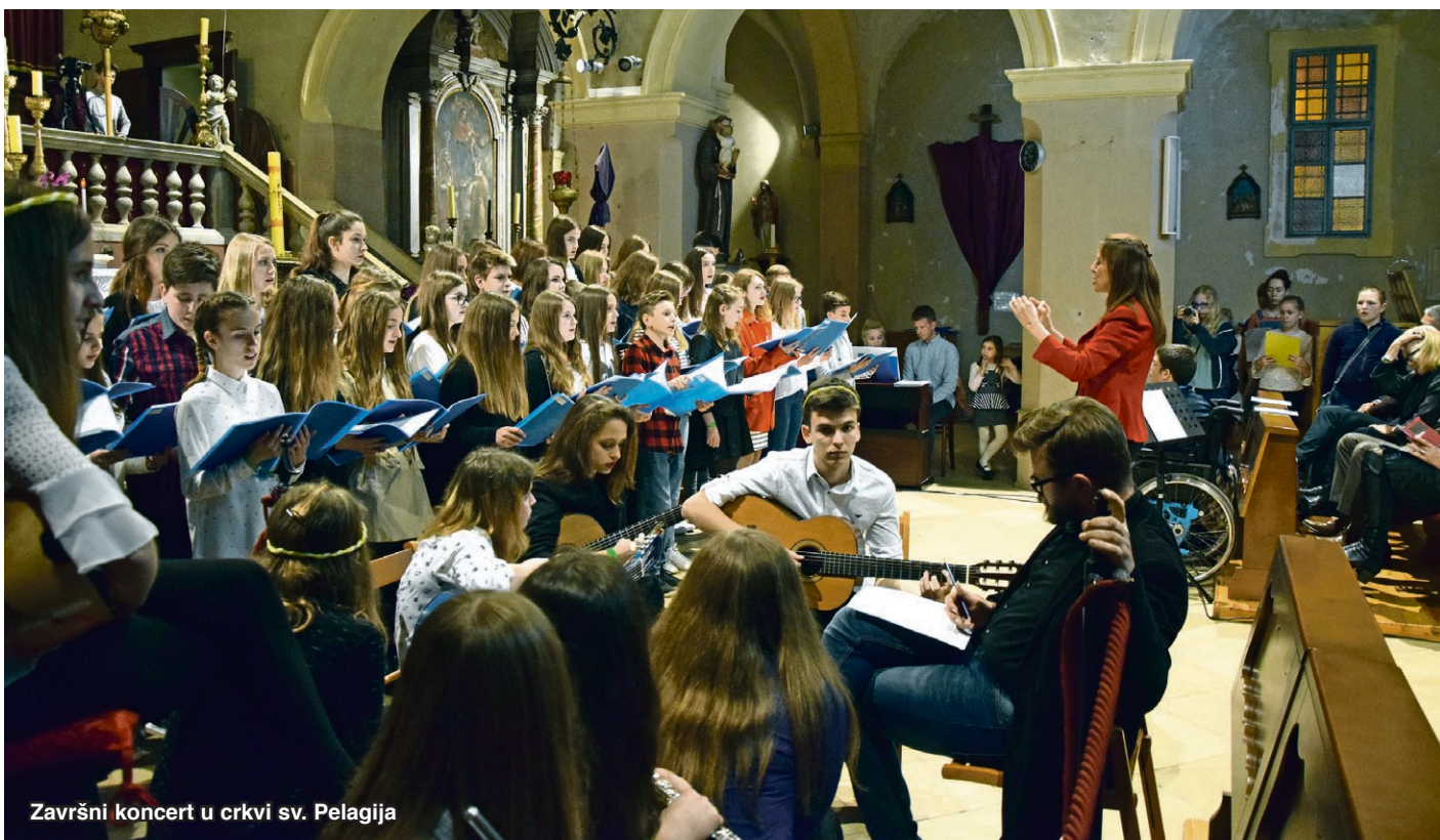
Završni koncert u crkvi sv. Pelagija