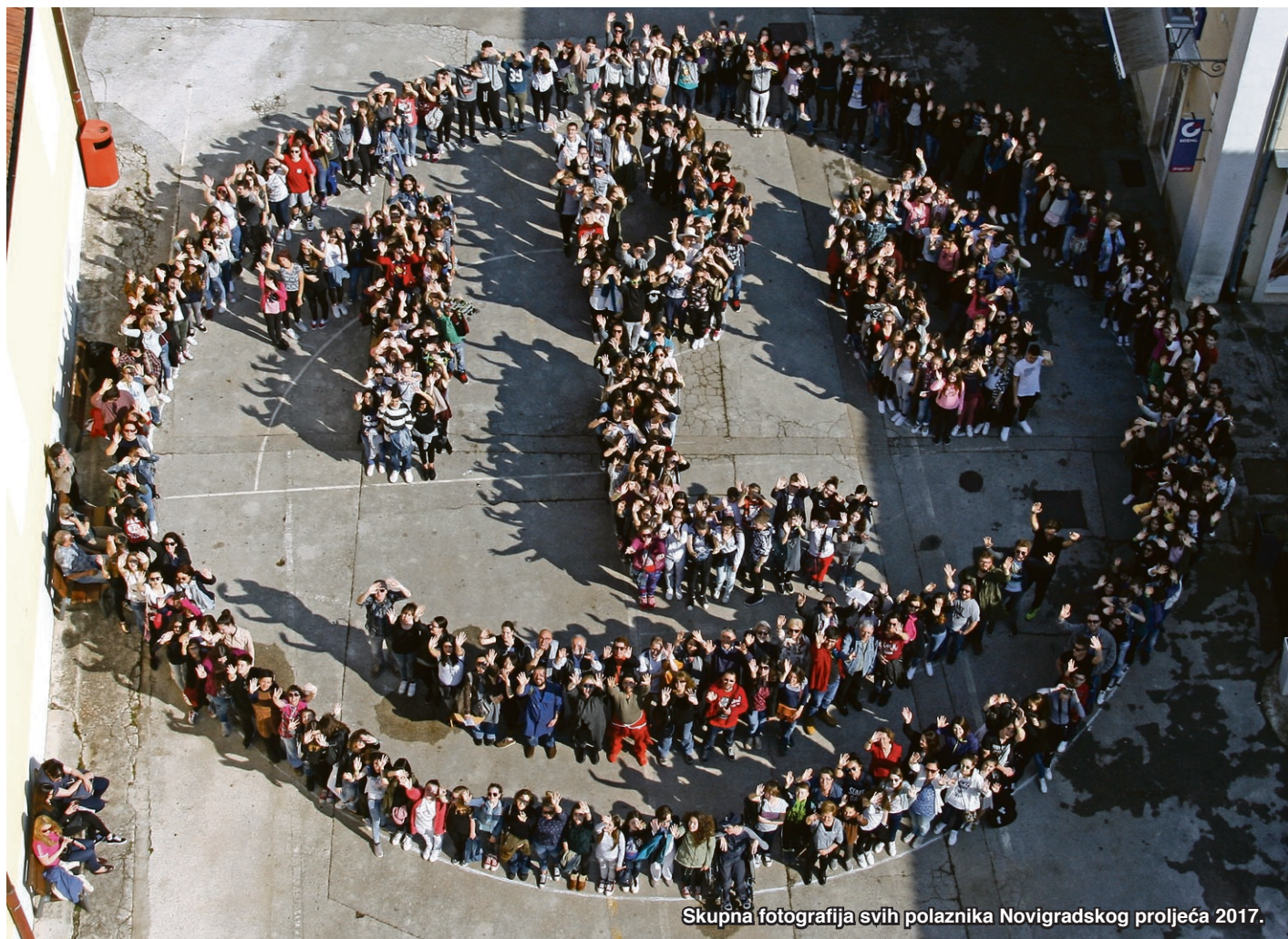
Skupna fotografija svih polaznika Novigradskog proljeća 2017.

Načela i ciljevi Škole ostvaraju se na različite načine. Planove i programe radionica izrađuje i osmišljava svaki voditelj (poštujući opći program, uz mogućnost promjene i stupnjevanje unutar skupine). Metode i oblici rada stalno se izmjenjuju (individu-