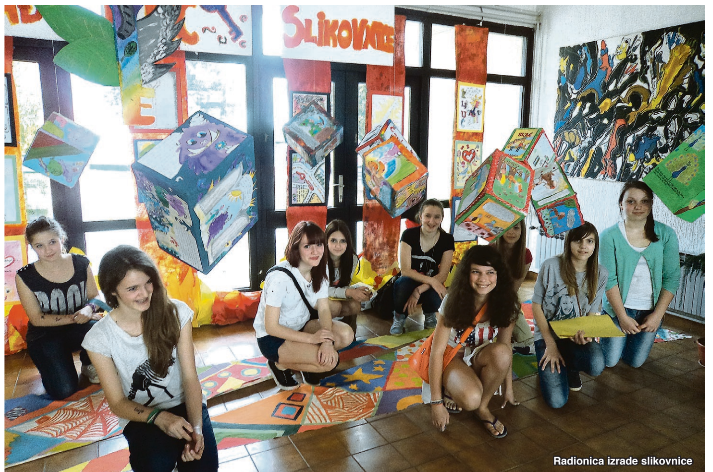
Radionica izrade slikovnice